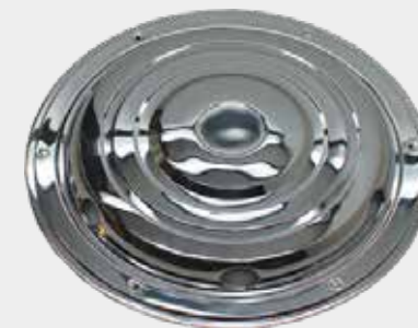
ART.NR: 621125 Radkappe vorne 17,5" Edelstahl Typ: Standard - 6-Loch Inkl. Lock-Ring-System