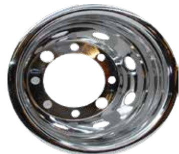
ART.NR: 621092 Radkappe hinten 22,5" x 8,25" Edelstahl 10-Loch Tiefe: 280 mm