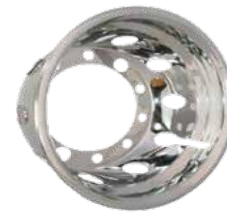
ART.NR: 621094 Radkappe hinten 22,5" x 11,75" Edelstahl 10-Loch Versatz/Et 0.