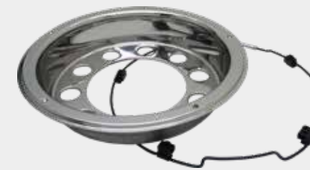
ART.NR: 621070 Felgenreing 22,5" - Baghjul Edelstahl Mittel Loch: Ø280 mm Tiefe: 120 mm Inkl. Lock-Ring-System