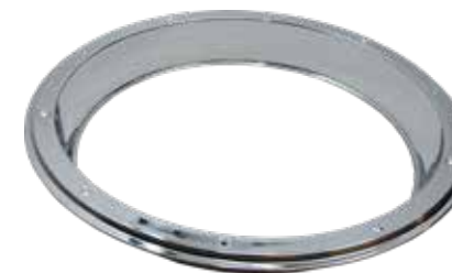
ART.NR: 621086 Felgenreing 22,5" Tiefe: 82 mm Edelstahl Für Standard hinten und super single Inkl. Lock-Ring-System