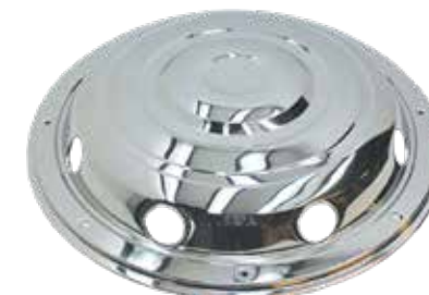
ART.NR: 621123 Radkappe vorne 19,5" Edelstahl Typ: Standard - 8-Loch Inkl. Lock-Ring-System