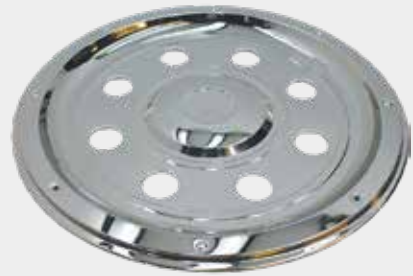
ART.NR: 621124 Radkappe vorne 19,5" Edelstahl Typ: Standard - 8-Loch Inkl. Lock-Ring-System