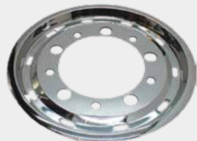
ART.NR: 621128 Radkappe vorne - Super Single 22,5" x 11,75" Edelstahl Tiefe: 27 mm Versatz: 130 mm Innen: Ø281 mm Scania, DAF, Iveco