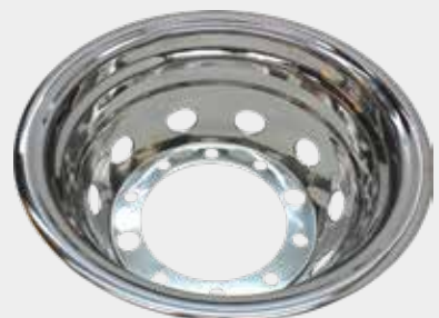
ART.NR: 621087 Radkappe hinten 22,5" x 9" Edelstahl 10-Loch Tiefe: 300 mm