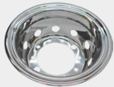
ART.NR: 621088 Radkappe hinten 22,5" x 8,25" Edelstahl 10-Loch Tiefe: 285 mm