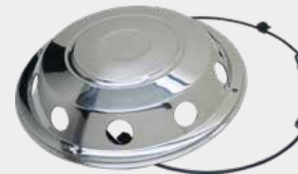
ART.NR: 621063 Radkappe vorne Schwedischer Typ 19,5" Edelstahl 8-Loch Inkl. Lock-Ring-System