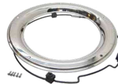
ART.NR: 620008 Felgenreing - Super Single 22,5" - Radkappe vorne Edelstahl Inkl. Lock-Ring-System