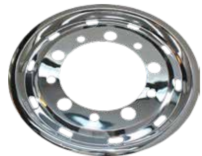
ART.NR: 621127 Radkappe vorne - Super Single 22,5" x 11,75" Edelstahl Tiefe: 37 mm Versatz: 120 mm Innen: Ø281 mm MAN, MB, Volvo, Renault, Iveco