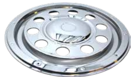
ART.NR: 621122 Radkappe hinten 22,5" Edelstahl Typ: Standard - 10-Loch Inkl. Lock-Ring-System