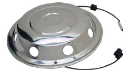
ART.NR: 621065 Radkappe vorne Schwedischer Typ 17,5" Edelstahl 6-Loch Inkl. Lock-Ring-System