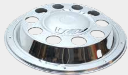
ART.NR: 621121 Radkappe vorne 22,5" Edelstahl Typ: Standard - 10-Loch Inkl. Lock-Ring-System