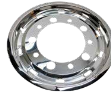
ART.NR: 621129 Radkappe vorne - Super Single 22,5" x 11,75" Edelstahl Tiefe: 41 mm Versatz: 120 mm Innen: Ø281 mm