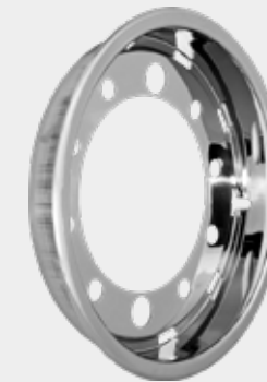
ART.NR: 621076 Radkappe - Super Single 19,5" x 14" Edelstahl 10-Loch Tiefe: 74 mm Versatz: 120 mm