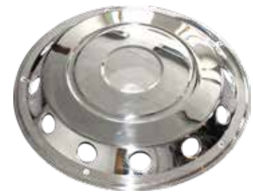
ART.NR: 621061 Radkappe vorne Schwedischer Typ 22,5" Edelstahl 10-Loch Inkl. Lock-Ring-System