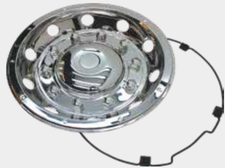
ART.NR: 621085 Radkappe hinten 22,5" Deluxe Edelstahl 10 integrierte Radmutterkappen Tiefe: 93 mm Mittelabdeckungen: ø250 mm Inkl. Lock-Ring-System