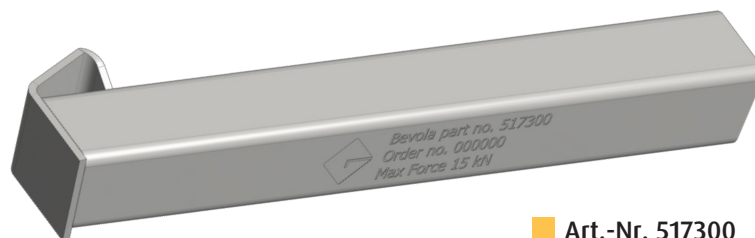
■ Art.-Nr. 517300